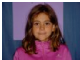
LEIRE.N: EZ DAUKAT