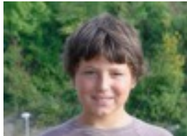
AMETZ ETA KIMETZ