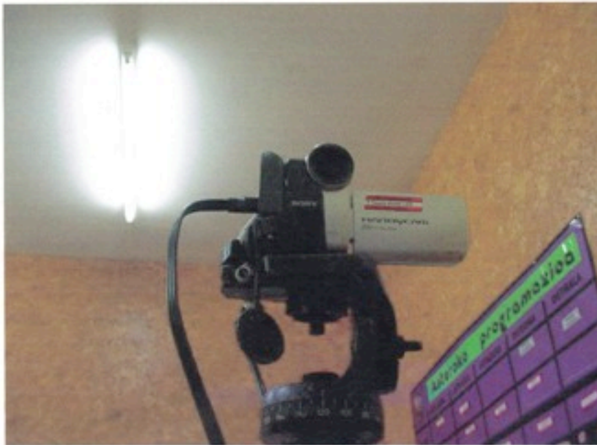
AMARA BERRIKO KAMARA MAGIKOA