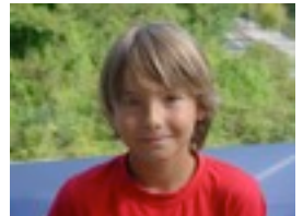
JON H: Ane.