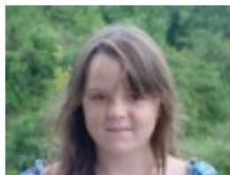
Ane I: Piqué