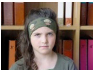
Egilea: Naroa Eizaguirre