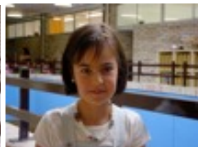
Ane: Piratas del caribe

Inkestaren emaitzak Jendea ez da adoz jartzen