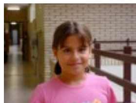
Amaia: High School Musical 2