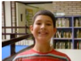
Lander: Scary Movie 3