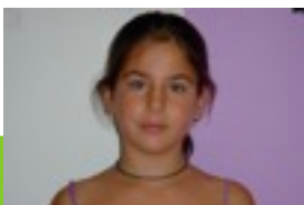
egilea: Nerea Azcona