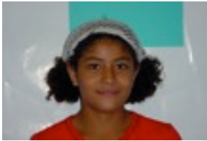
Egilea: Sofía Martínez