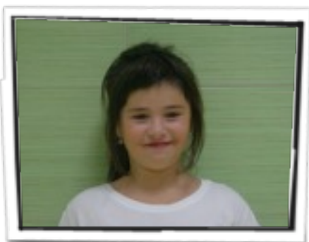
Egilea: Ane Hernandez