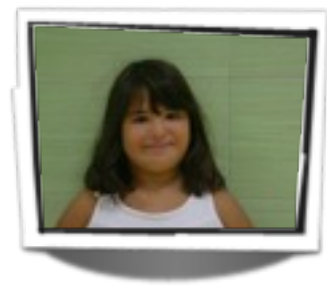
Egilea: Carlota Berrueta

GIZONAK EGITEN NAU GIZONAK APAINZEN NAU GIZONAK BEROTZEN NAU GIZONAK TEILAZ ESTALTZEN NAU. NOR NAIZ NI?