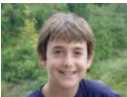
Nire anaia- rekin