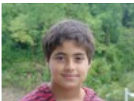
Adriana Lima- rekin