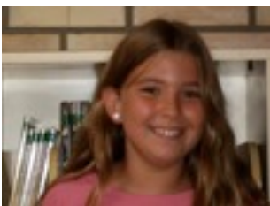
EGILEA: Paula Vega