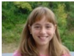
Mainer: Ez dakit