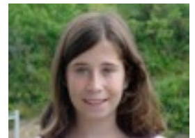
Clara: ,Ane motza delako