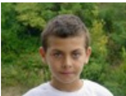
Kepa: Jon, polita delako