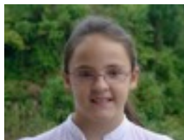
Maren: Piperron, piperrak ez zaizkidalako gus- tatzen