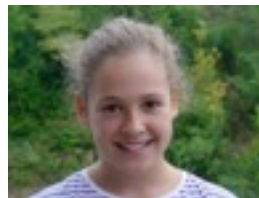
Julia: Maria, polita delako