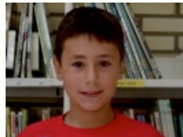
Egilea: Gorka Lorenzo