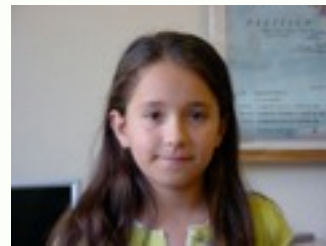
Egilea: Ane Garrido