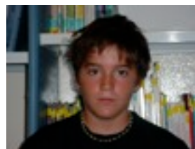
GUITAR HERO 3