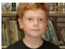
Egilea: Iker G.

Espainia afhgnistan Pakistan Uzbekistan Indonesia Tadjikistan