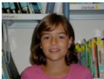
Egilea: ANDREA SIERRA