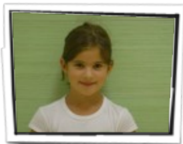
EGILEA. Estitxu Olaizola.

Lili lore, Lili lore, lili lore, liraina, lili lore, lili lore Leirentzat eramana, lo- reak udaran loretzen dira Leireren sorretan. Leire alaiak udaran bizitzen ditu loraturiko loreak