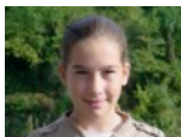
Naia Niri navidades en verano gustatzen zait