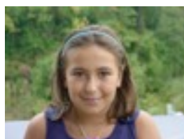
Zuriñe niri heroes gustatzen zait