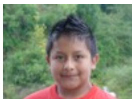
Carlos niri acero puro gustatzen zait