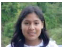
Elisabeth niri crepusculo gustatzen zait

Inkestaren emaitza: Acero puro izan da gehien gustatzen den filma.