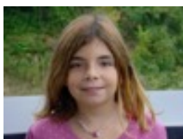
Alejandra Niri heroes gustatzen zait