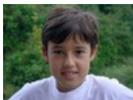
Adrian niri acero puro gustatzen zait