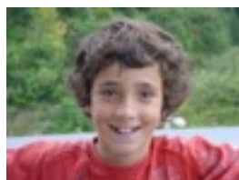
Andoni niri termineitor gustatzen zait