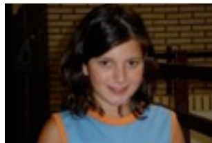
EGILEA: LAURA REZOLA