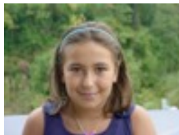
Los Magos waverly place