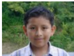
La hora de Jose Mota