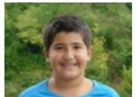
El día después