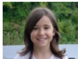
La hora de Jose Mota