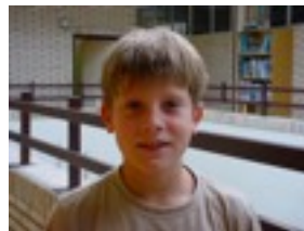
UNAI B Sofan etzanda egotea