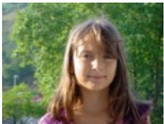
EGILEA: PAULA PEREZ

Bere gurasoek neska non zegoen jakin ondoren segituan joan ziren eta denak elkarrekin zeudela oso pozik zeuden.