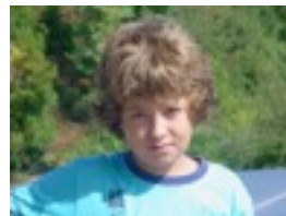
OIHAN: PLAY 3