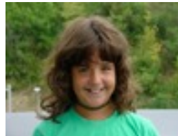
IBONE: IXEIA ETA AIHNOA