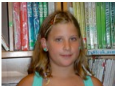
Egilea: Clara Alberdi

Arauk: Bilatu munduko zortzi irla, goitik behera, eskubitik ezker- rera eta ezkerretik, eskubira egon daitezke. Animo aurkitu!!