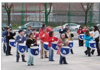
Amara Berriko ikasleak entsaio batean (2006)

Larunbatean, urtarrilak 20, San Sebastian egunean, Amara Berri ikastetxeak parte hartu zuen. Amara Berriko barrilak eta danborrak Ferreriaseko patioan elkartu ginen 10:15etan, gero autobusa hartu genuen udaletxeara joateko. Hor gailetak, gozokiak eta ura eman ziguten. Azkenik, Donostiako kaleetan zehar danborra jo genuen.