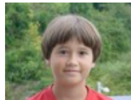
Alai: Aste nagusia