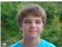
Martin: Aste nagusia