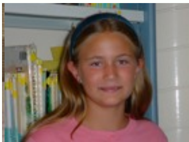
Egilea: Andrea Gonzalez

3-i'm an animal. i'm brown and black i've got a yellow neck lace i have my tongue out