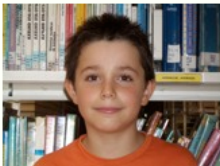
Egilea: Jon Matute