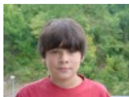
KOALA ETA PANDA HARTZA