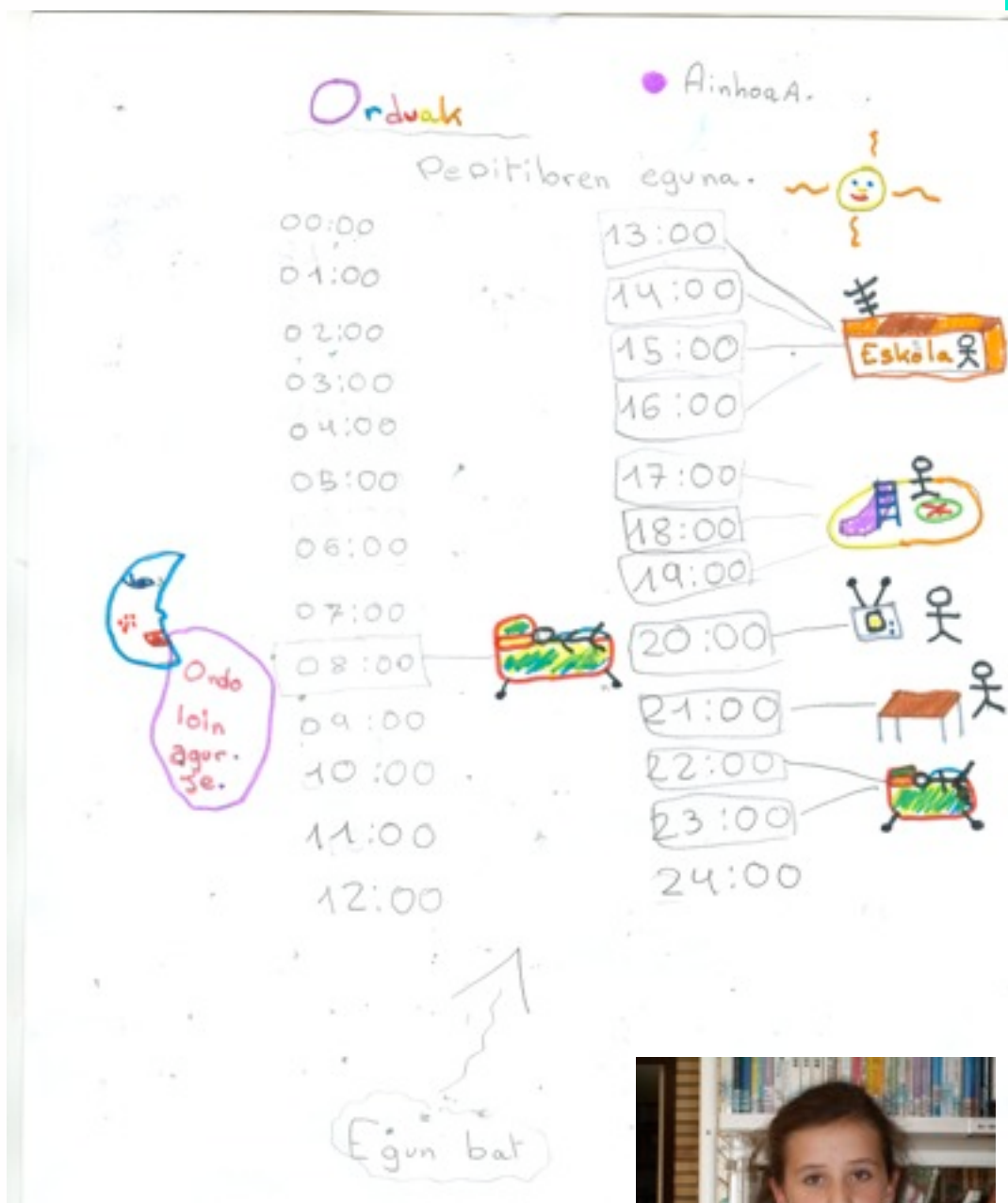
Egilea: Ainhoa Aguirre