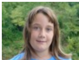
Ane: J.J, oso jatorra delako.