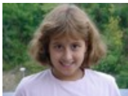
Mar: J.J, oso jatorra delako.