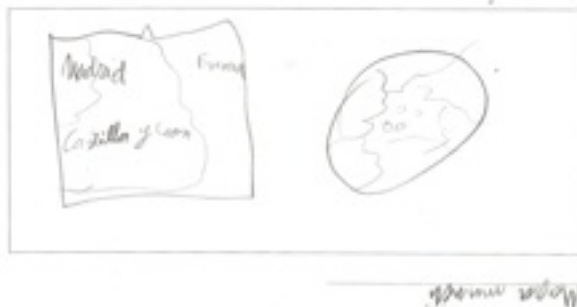
Egilea: Aitor Marques

Te lleva a sitios para que no te pierdas.