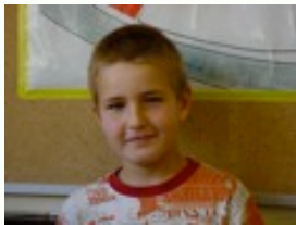
Autor: Aitor Marques

Instrucciones: hay 8 luchadores de pressing catch; 7 en horizontal y 1 en diagonal.