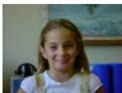
Egilea: Andrea Dabo

Hola amigos tenéis que buscar el nombre de siete fieras. Tenéis que buscar cuatro horizontales, dos verticales, y dos diagonales.