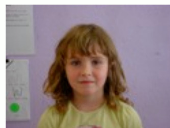
Egilea: Ana Fria