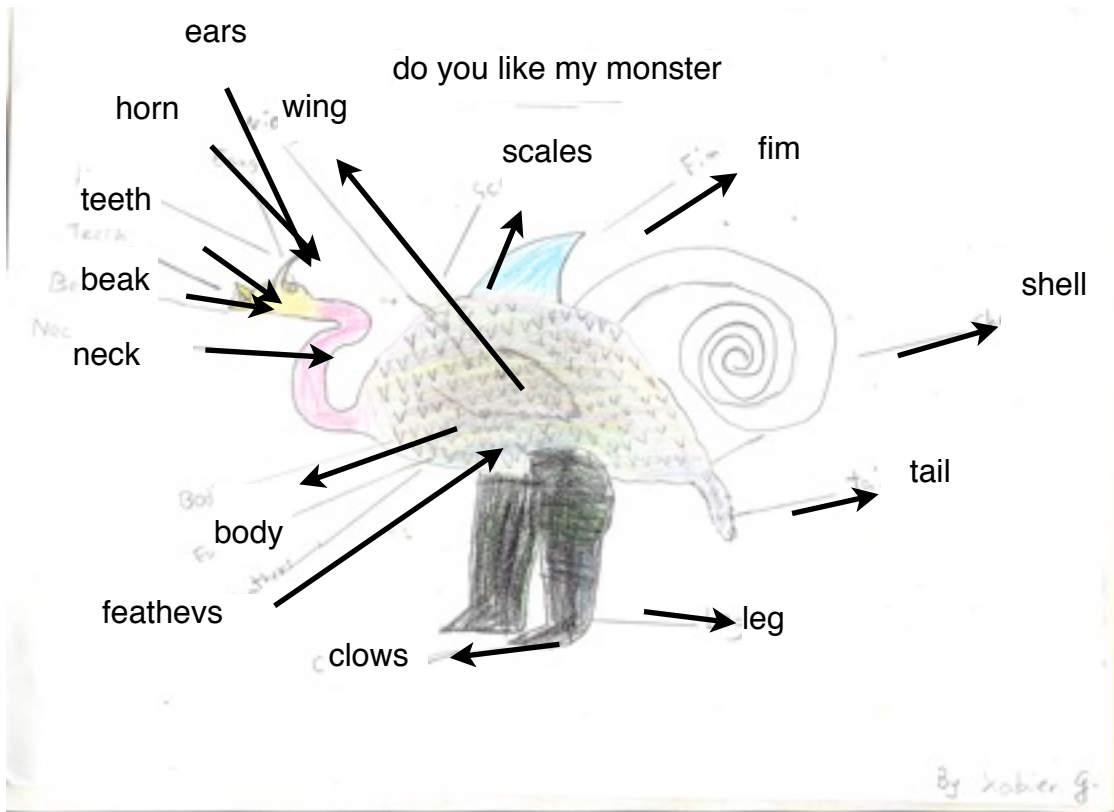
Egilea: Xabier G.