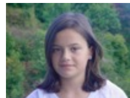
Miren Solabarrieta: La que se avecina