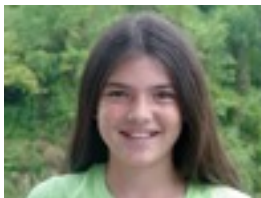
Maialen: Txakurren pelukera.