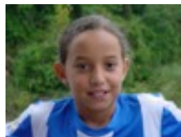
Irati: EZ DAKIT