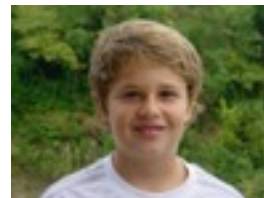
Ander: XAVI HERNANDEZ