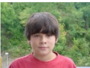
Egilea: Mikel Malagon

Gure Lur planetan bada toki zabal eta luze-luze bat, lurraren maindirea balitz bezala dago. Toki lasai-lasai bat inongo gizakirik gabe, baina maindirearen azpian badago bigarren mundu bat. Han ez dago borrokarik ez da militarrik, denak bakean daude eta pozik. Bat-batean inoiz ez zen bukaera paisai gauza txiki eta polit bat agertu da. Txikia baina indartsua da eta gizakiak ezezagutzen duen toki magiko hau buruz daki buruan mapa bat eukiko balu bezala da. Orduak daramatza bere gorputz sigi-saga mugitzen lurreko espazioan inora joango balitz bezala dabil baina azkenean itxaropenarekin bere etxera iristen da eta bere familiak zorionez ongi-etorria ematen dio. Iristerakoan norbait falta dela sumatzen du. Etxe guztitikan bilatu ondoren aurkitu du. Bere arreba falta zen eta zertan zegoen? Deskantsatzen zegoen koral batzuen artean baina ez zegoen ondo, zer gertatzen zitzaien? Familian pertsona berriak zeuden!! oso txikiak dira baina pila-pila bat ehun eta gehiago! beraien gorpua txiki-txikia zen baina beraien amaren berdina. Isatsaren bukaeran puntu beltz bat zuten bere amaren ezugarri berdina. Beraien bizitzako lehen ordu erdian igerian ikasi dute eta orain ehizatzen ikasten hasi dira. Gure Lur planetako itsasoan bizi irauteko.