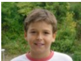
JON: Nire nobiarekin.