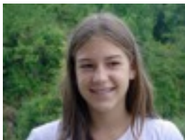
NORA: Lagun guztiekin .