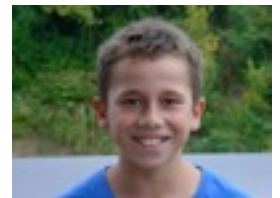
KERMAN: Nire nobiarekin.