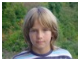
Ander: Michael Jackson+ eta Justin Bieber -