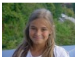
Blanca: Michael Jackson bizirik.