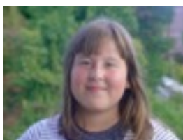
Amaiur: Michael Jackson bizirik.