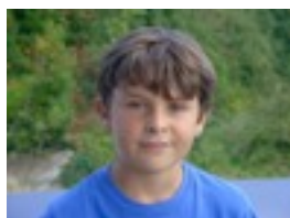
Iñigo: Michael Jackson