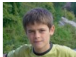
Jokin: Michael Jackson+ eta Justin Bieber-