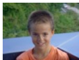
San Felix: Michael Jackson.