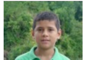
Andres: -Sekretu bat da.