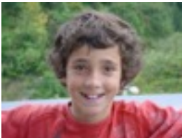
Andoni: -Inor ez