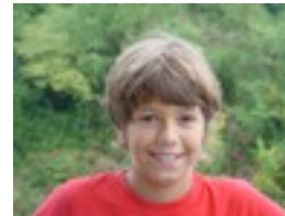
Paul: -Inor ez