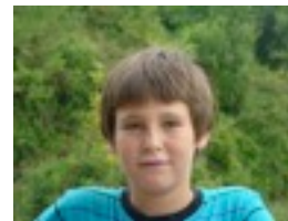
Julen: Campamentora joan