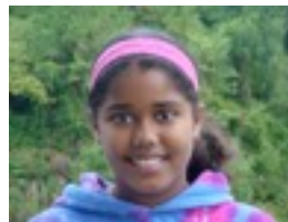
Esmeralda: Lagunekin gelditu