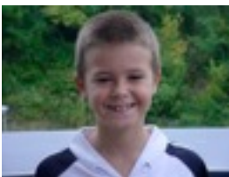
Unai: Portaventurasera joan