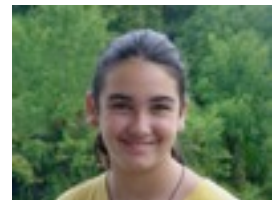
Olatz: Hondartzara joan