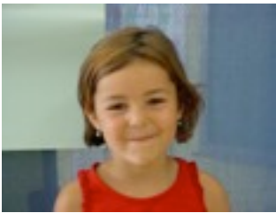
egilea: Clara Moreno

Txanogorritxo dut izena amonaren etxera noa amonatxo ikustera.