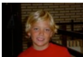
Errioxara, Najera eta