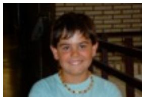
Benidorm eta Landeta- ra.