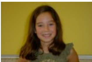
Egilea: Idoia Aranburu