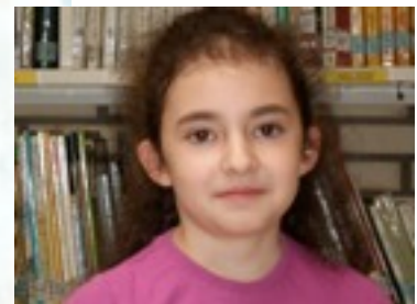
EGILEA: CLARA LANDARIBAR