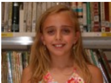
EGILEA: Sonia Aznar