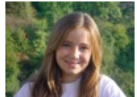
Miley Cyrus eta Lilly Allen