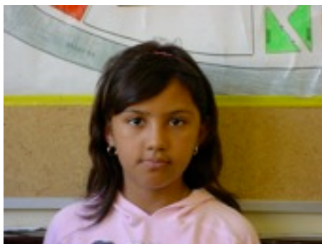
Egilea: Maite Almeida