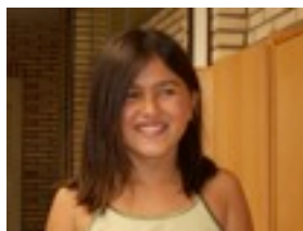
Oyana La oreja de Van- Gogh.