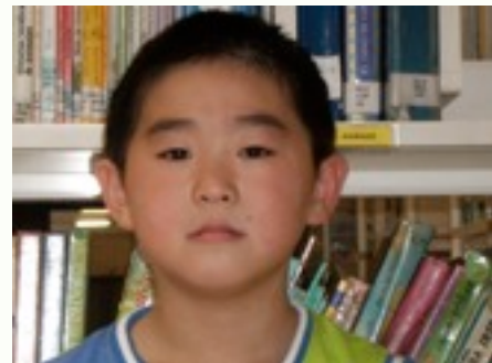
Egilea: Hao Hao Zhan.