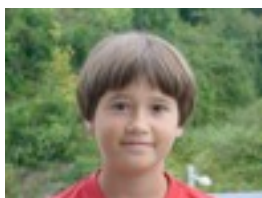
Harry Potter y las reliquias de la muerte