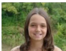
Viaje al cen- tro de la tie- rra

Pelikula gustokoena: Viaje al Centro de la Tierra