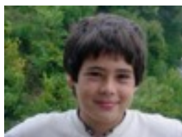
El Señor de Los Anillos 2