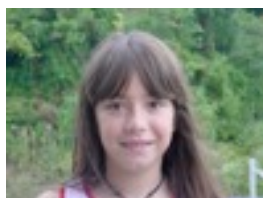
Fuga de Cerebros